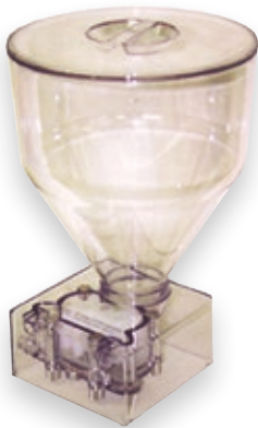
Trichter für Gebäckfüller

Zur Ergänzung unserer Donut - Fritteusen und Gebäckfüller bietet MONO Equipment auch eine umfassende Bandbreite an Zubehör für diese Geräte an.