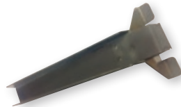
Griffe für Donutwanne