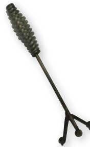
Zubehör für Donutwanne