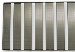
Wanne für Donut - Fritteuse Aztec